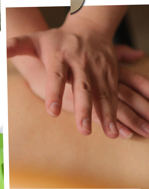
Massage traditionnel chinois

Extérieur + piscine - 653 chemin de St Jean