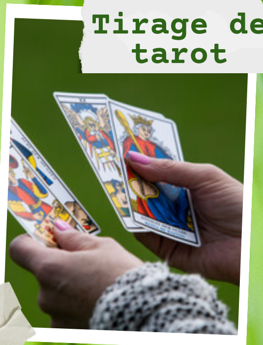
Tirage de tarot